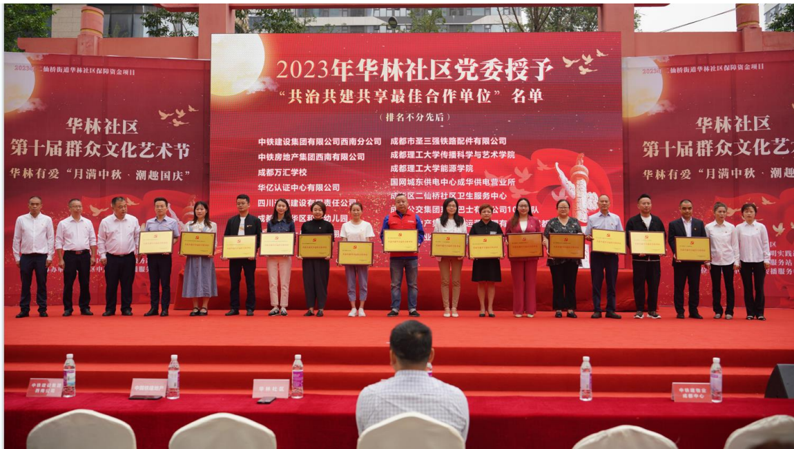
2023年共治共建共享最佳合作单位表彰会