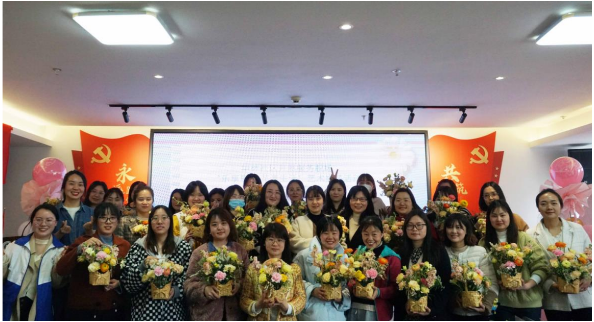
2023.3.7 女神节健康知识暨插花艺术讲座