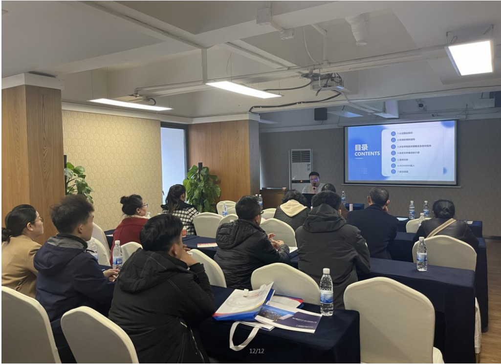
2023.11.30 参加达州市“天府益企计划·特殊类型地区 中小企业服务专项行动