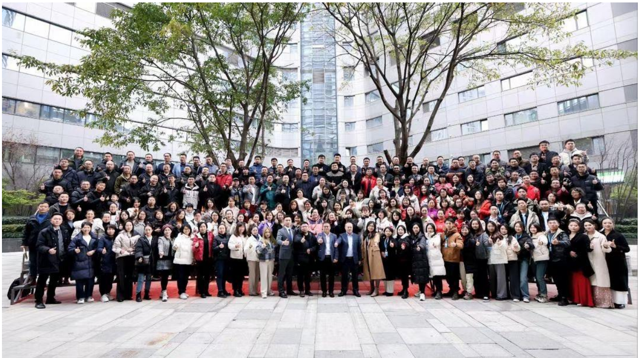
2024.1.5 公司成立六周年年会

(2) 坚持专业化发展，根据专业能力设置不同级别审核员、储备并鼓励审核员进行多体系发展，培养复合型认证人才；为员工提供多元化职业发展通道。根据各板块业务发展规划，推出储备人才培养计划，全面加强知识产权板块、工业与服务业板块的人才储备。在知识产权业务版块提供定制化系统培训，通过 1-2 年