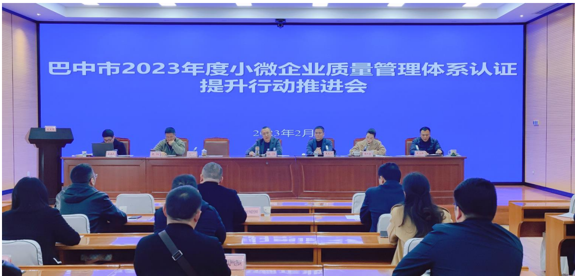
2023 年巴中小微企业质量管理体系认证提升行动推进会

积极响应认监委关于小微企业质量管理体系认证提升行动倡议，2023.02.28 参加巴中市小微企业质量管理体系认证提升行动；2023.11.30 参加达州市“天府益企计划·特殊类型地区中小企业服务专项行动”。此外，本机构参与小微企业提升活动荣获省级优秀案例，并完成了《小微企业知识产权提升指南》。